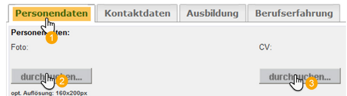
Foto und CV hochladen

Laden Sie unter «Personendaten» (1) > «Bearbeiten» Ihr Foto (2) (160x200px) und Ihr CV (3) hoch.