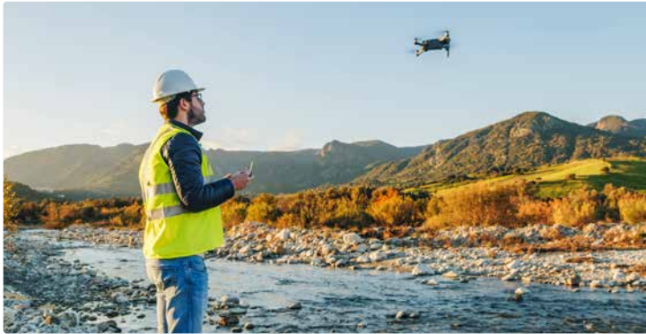
Luftaufnahmen zur Erfassung der Vegetation im Schutzgebiet.

In den letzten zwanzig Jahren hat sich die Zahl der Beschäftigten im Umweltsektor mehr als verdoppelt. Nachhaltigkeit und Umweltbewusstsein werden über alle Branchen und Unternehmen hinweg immer wichtiger. Mitarbeitende, die komplexe Zusammenhänge zwischen Umwelt, Wirtschaft und Gesellschaft erkennen und in der Lage sind, nachhaltige Innovationsprozesse zu initiieren, zu begleiten und umzusetzen, sind zunehmend gefragt.