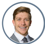
Jan Stäldi Events