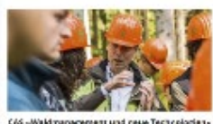
Waldmanagement und neue Technologien

Le rendez-vous 2026, consacré à l'ère des données, se tiendra à la fin de l'été 2026. L'association Alumni BFH-HAFL a le plaisir de vous inviter à cet événement qui sera l'occasion de rencontrer des experts du domaine et de découvrir les dernières tendances du marché. Le thème de l'événement est « Savez l'ère Data! ». L'association Alumni BFH-HAFL a le plaisir de vous inviter à cet événement qui sera l'occasion de rencontrer des experts du domaine et de découvrir les dernières tendances du marché. Le thème de l'événement est « Savez l'ère Data! ».