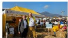
Rendez-vous en 2026 - Savez l'ère Data!

Le rendez-vous 2026, consacré à l'ère des données, se tiendra à la fin de l'été 2026. L'association Alumni BFH-HAFL a le plaisir de vous inviter à cet événement qui sera l'occasion de rencontrer des experts du domaine et de découvrir les dernières tendances du marché. Le thème de l'événement est « Savez l'ère Data! ». L'association Alumni BFH-HAFL a le plaisir de vous inviter à cet événement qui sera l'occasion de rencontrer des experts du domaine et de découvrir les dernières tendances du marché. Le thème de l'événement est « Savez l'ère Data! ».