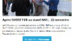
Après SUISSE FER au stand HAFL - 22 novembre

Le rendez-vous 2025, consacré à la gestion durable des forêts et aux nouvelles technologies, se tiendra à la fin de l'été 2025. L'association Alumni BFH-HAFL a le plaisir de vous inviter à cet événement qui sera l'occasion de rencontrer des experts du domaine et de découvrir les dernières tendances du marché. Le thème de l'événement est « Waldmanagement und neue Technologien ».