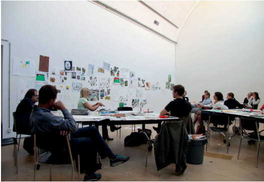
Denk- und Diskussionsrunde mit den 18 Persönlichkeiten.